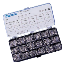
Идентиф. номер G203763A